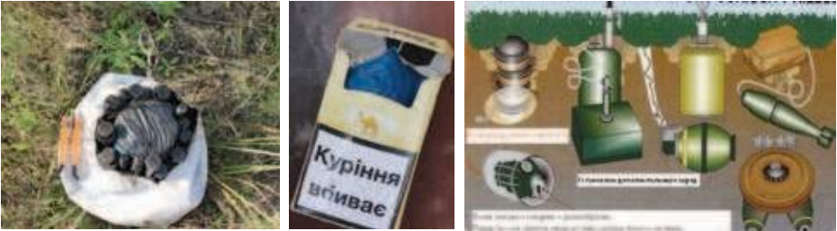
Замаскована міна-пастка у м'ячі, пачці з-під цигарок і основні види мінування. Зона можливого ураження в радіусі 150 м

МИНА-ПАСТКА – спеціальний пристрій, який може бути замаскований під безпечні на вигляд предмети побуту. Пристосований для того, щоб убивати чи завдавати ушкоджень. Спрацьовує раптово, коли людина торкається чи наближається до начебто нешкідливого предмета або здійснює, здавалося б, безпечну дію. Найчастіше встановлюються в будинках, спорудах, поблизу предметів повсякденного вжитку, зброї, дитячих іграшок.