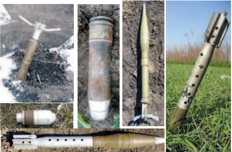
Постріли з гранатометів